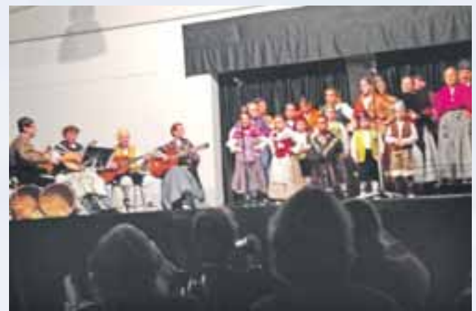
Festival de Folclore Navideño.