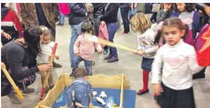
Juegos Tradicionales de Navidad.