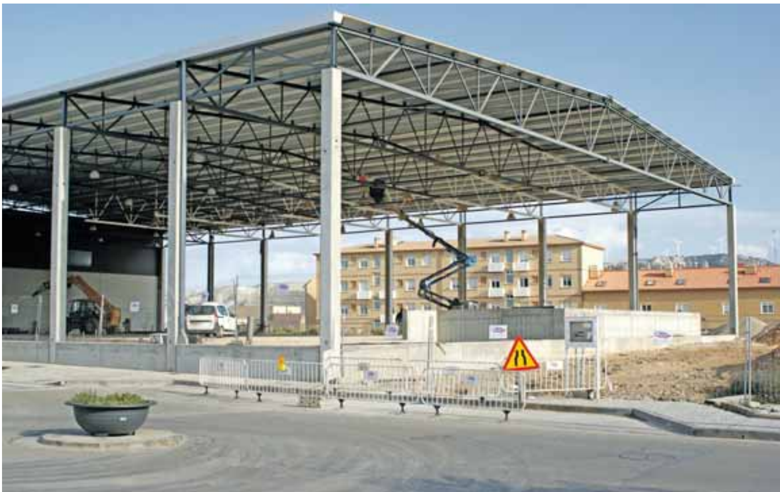
Imagen de las obras para la construcción del Polideportivo.

Las obras para la construcción del Polideportivo Municipal de María de Huerva avanzan en una segunda fase en la que se construirá la pista principal. A la práctica de modalidades deportivas como baloncesto o fútbol sala se une la disponibilidad de un amplio escenario para celebrar eventos culturales y sociales, con lo que las asociaciones y clubes locales también podrán aprovechar la nueva instalación. El tiempo de realización de las obras se calcula en 12 semanas, aunque se van ejecutando según la disponibilidad en los presupuestos del Ayuntamiento.