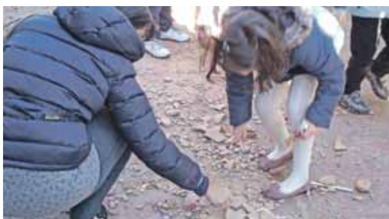
El juego de las cucañas es el favorito de los más pequeños.