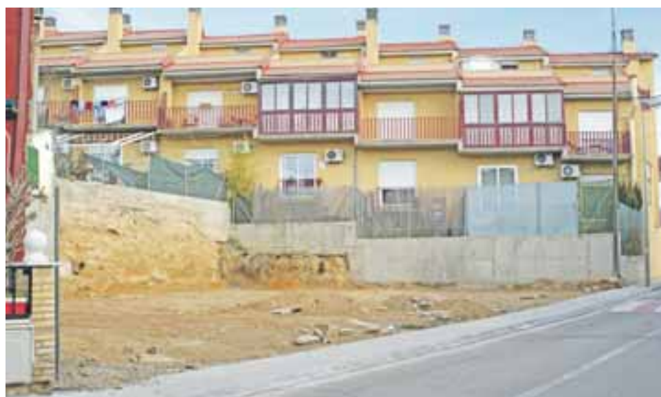
Con esta ordenanza se trata de evitar el abandono y desidia de los propietarios sobre los solares vacíos.

En el caso de no haber cumplimentado el requerimiento dirigido al propietario, el Ayuntamiento podrá usar cualesquiera de los medios de ejecución forzosa para proceder a la limpieza y vallado del solar o a garantizar el ornato de una construcción y en particular la ejecución subsidiaria de la obra o actuación cuando el obligado incumpliera la orden de ejecución y fueran necesarias para la conservación de la seguridad, salubridad, ornato público y calidad ambiental y turística.