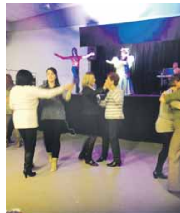
La celebración de Santa Águeda convocó a muchas socias y amigas.