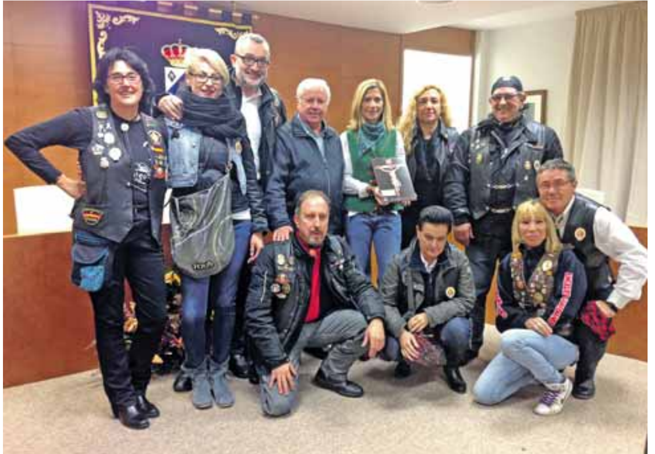
El Hermano Mayor de la Hermandad del Santo Refugio y representantes de las asociaciones moteras, durante la entrega de la placa.

Días antes, los voluntarios del Banco de Alimentos de María de Huerva pudieron visitar esta institución para conocer su obra y la forma en la que se gestiona, organiza y administra esta obra social que atiende a miles de familias anualmente ofreciendo comida, alojamiento y ropa. “Además de la más valiosa ofrenda que es el calor, cariño y comprensión de las personas que se dedican a esta encomiable tarea”, señalan los voluntarios.