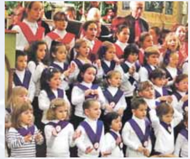
Actuación incluida dentro del Ciclo Musical de Adviento.

ragocista "Ribera del Huerva" y la Asociación de Mujeres "El Lugar Viejo" respectivamente. También se celebraron más actos deportivos como el Clínic Menudos MTC, organizado por el María Tenis Club (MTC), la jornada de puertas abiertas del