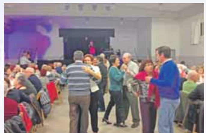
Celebración de la Asociación 3ª Edad Bienvenida.