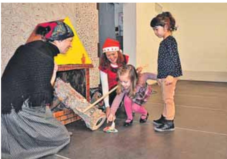
Niños reclamando sus dulces.