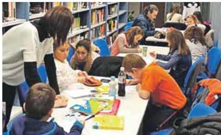
El horario es de lunes a jueves, de las 17.00 a las 19.00 horas.

El Ayuntamiento de María de Huerva también contempla la posibilidad de ofrecer este servicio en horarios más amplios coincidiendo con exámenes para estudiantes de etapas superiores o universitarios si existiera esta demanda. ●