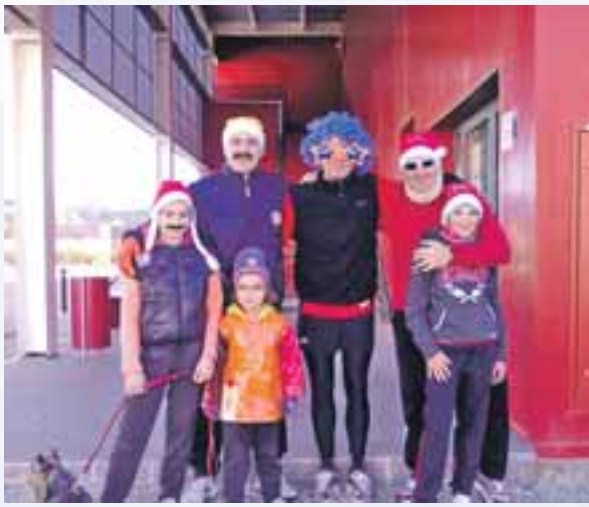
Imagen de algunos participantes de la San Silvestre.