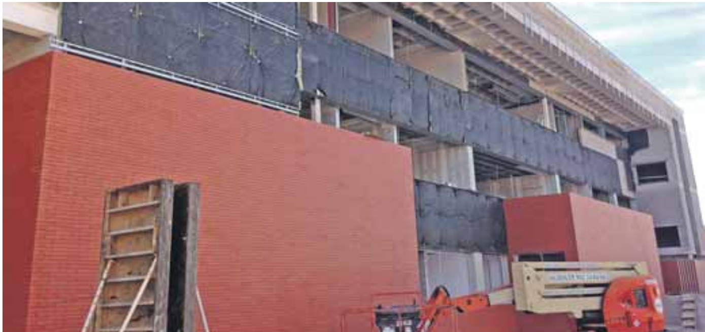
Ya se puede ver la estructura básica de la instalación.

Para el CEIP San Roque también habrá repercusión con la conclusión de estas obras, pues podrá recuperar muchos espacios como las aulas de desdoble, de música o la sala de profesores, que tuvieron que destinarse a aulas para impartir las clases. ●