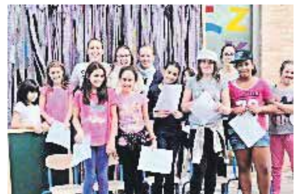
La Biblioteca tiene una gran variedad de actividades para los más pequeños.

Los Mayores también Cuentan. En colaboración con la Residencia de Ancianos María Auxiliadora, de María de Huerva.