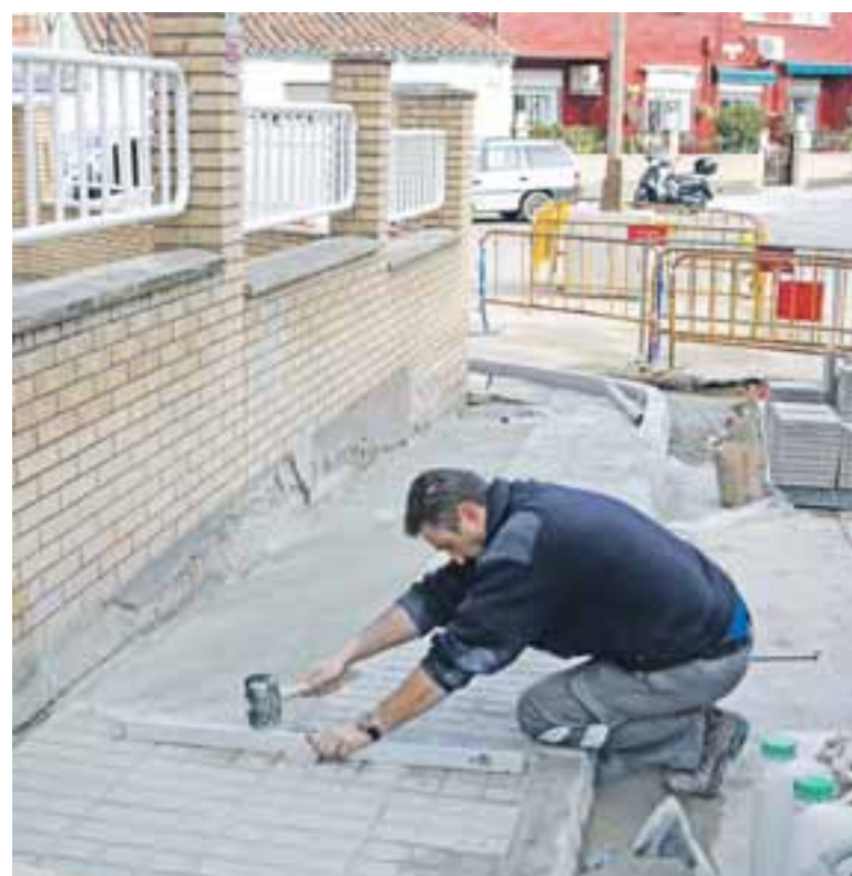
Las acciones se centran en aquellos tramos más deteriorados del casco urbano.

Por otra parte, en algún caso hay que trasladar árboles existentes en las aceras para trasplantarlos a otras zonas pues imposibilitan el paso de personas o carritos. Este Plan requiere una dedicación periódica para tener en buen estado de las calles del municipio y forma, por ello, parte del plan de trabajo municipal. ●