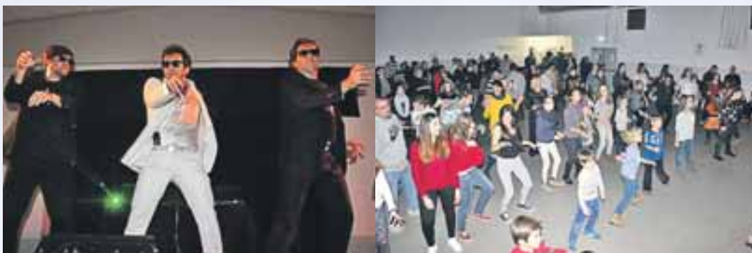
Cotillón de Reyes.