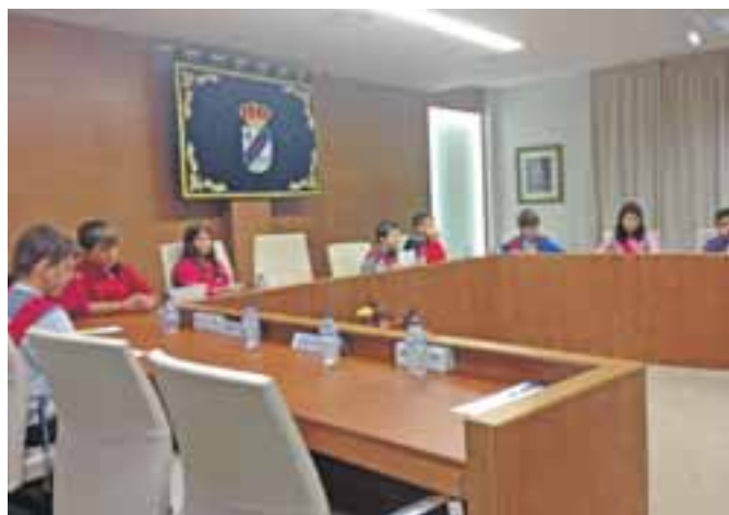
Jornada de Puertas Abiertas del CEIP San Roque.