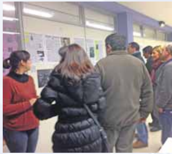
Exposición "Palabras e Imágenes".