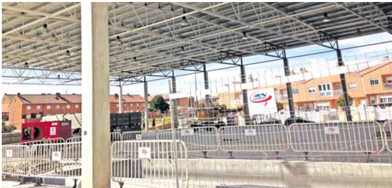
Ya se pueden observar los avances en la construcción del Polideportivo.

Los trabajos consistirán en el cerramiento de la pista, que constituyó la primera fase, y en la construcción de la pista principal para la práctica de aquellas disciplinas deportivas implantadas en María como son el baloncesto, balonmano, fútbol sala, trampolín, patinaje, exhibiciones de gimnasia rítmica, artes marciales, bailes deportivos... así como de las gradas para el público asistente a las actividades deportivas. También será adecuado para celebrar eventos culturales y sociales, dado que la nueva infraestructura incluye un amplio escenario. Como novedad, habrá un foso de caída para una disciplina en la que destaca el Club Huervatramp dentro del panorama deportivo de Aragón. La obra ha sido adjudicada a la