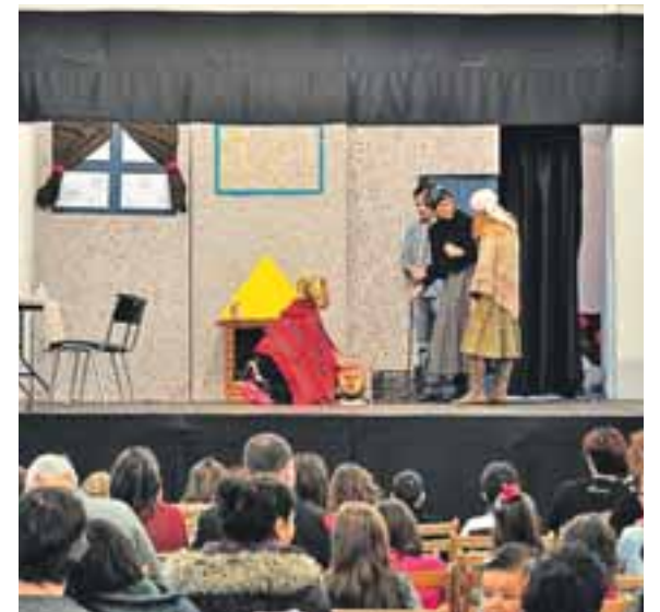
“La Tronca de Navidad” congregó a mucho público durante la representación de los papás y mamás.