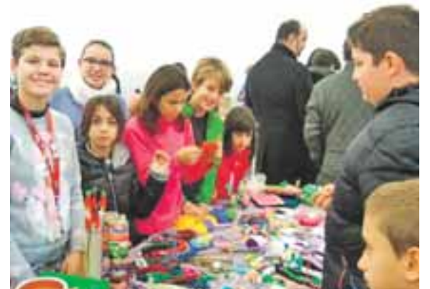
Las tardes de los viernes, sábados y domingos se organizan muchas actividades.