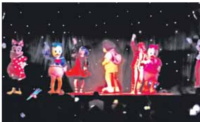
Los más pequeños disfrutaron de la visita de sus personajes preferidos.

Todos pudieron contagiarse de la espectacular puesta en escena, de las risas y chistes de los personajes y de las preciosas canciones, además de los números de acrobacia que realizaron. La magia del mundo de los niños siempre contagia a todo el público. ●