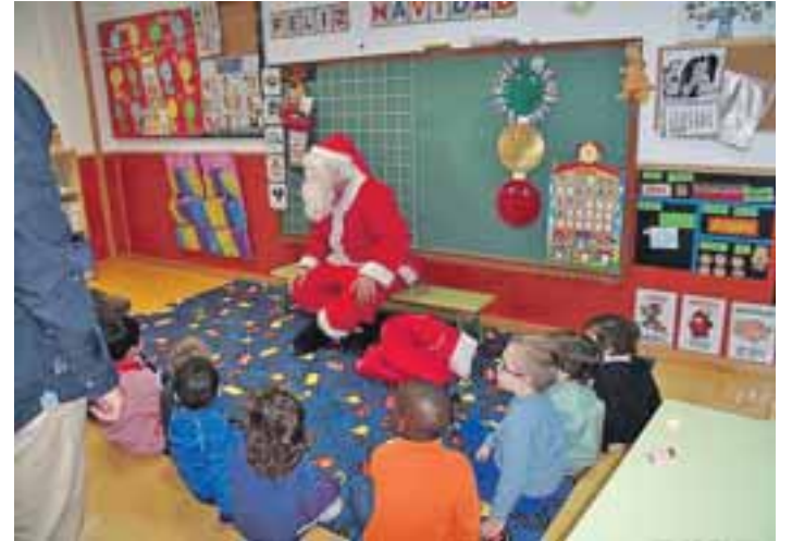
Papá Noel fue el protagonista de las actividades del CEIP San Roque.

Como colofón a la fiesta navideña, tuvo lugar en el Pabellón Municipal una tarde entretenida para todos los niños y sus fami-