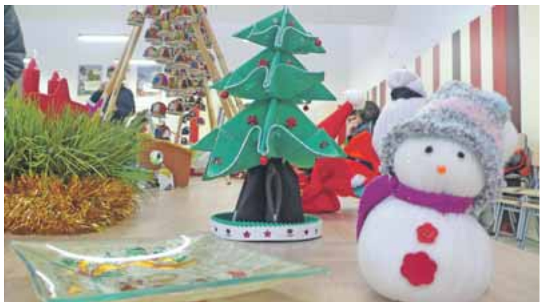
Mercadillo navideño promovido por el CEIP Val de La Atalaya.

El pasado 21 de diciembre, el AMPA del CEIP Val de la Atalaya, volvió a representar “La Tronca de Navidad” en el Pabellón municipal. Tras recuperar el pasado curso esta tradición navideña propia del Pirineo para los niños del colegio, este año se abrió la actividad a todo aquel que quiso participar. Mamás y papás voluntarios narraron en forma de obra de teatro la historia de esta tronca, indultada por una niña, que en agradecimiento obsequia a los niños con dulces navideños. Tras la representación, los más de 150 niños asistentes pudieron reclamar sus dulces