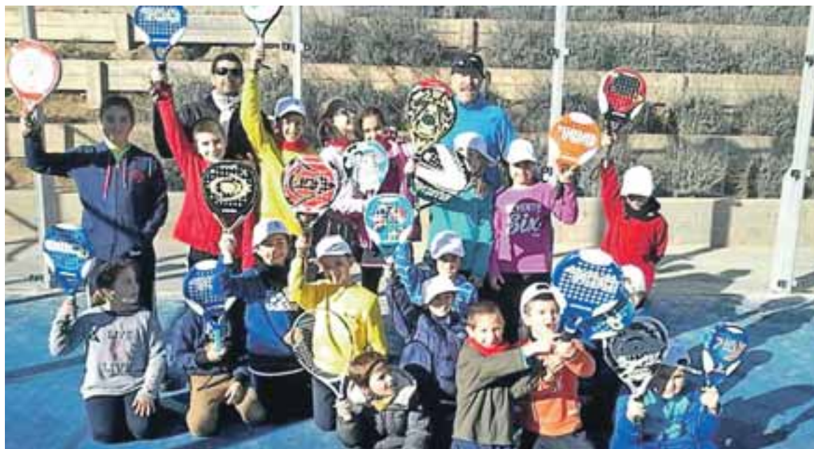
Los participantes se lo pasaron en grande.

Los niños jugaron, se iniciaron en nuevas disciplinas, aprendiendo primero y también compitiendo después, dieron buena cuenta de refrigerio y merienda y, por posteriores demostraciones suyas de agradecimiento, quedó constancia de que desean repetir experiencia en años venideros. Desde el Club de Tenis también se está pensando ya en ello. ◉