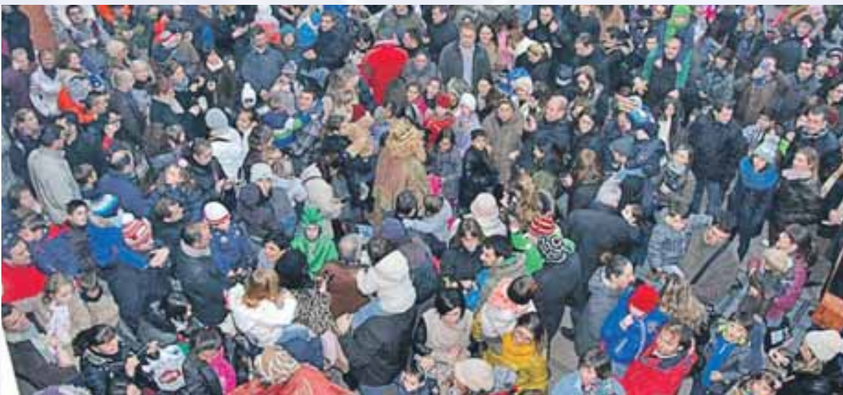
A la izquierda los niños esperando a los Reyes Magos. A la derecha la carroza de los Reyes Magos.