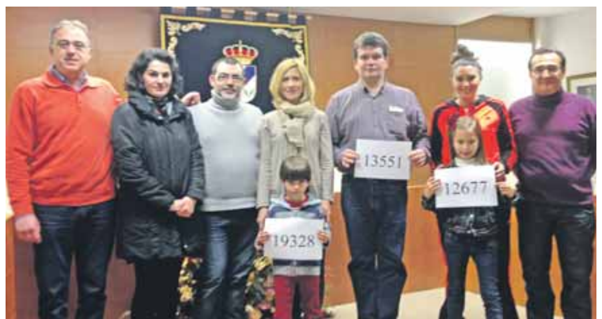
Tres vecinos fueron agraciados con talones para utilizar en los establecimientos participantes.

Para premiar la fidelidad de sus clientes y con la participación del Ayuntamiento y de la Asociación