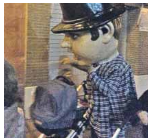
La música y la animación acompañaron la celebración del XIV aniversario de la asociación.