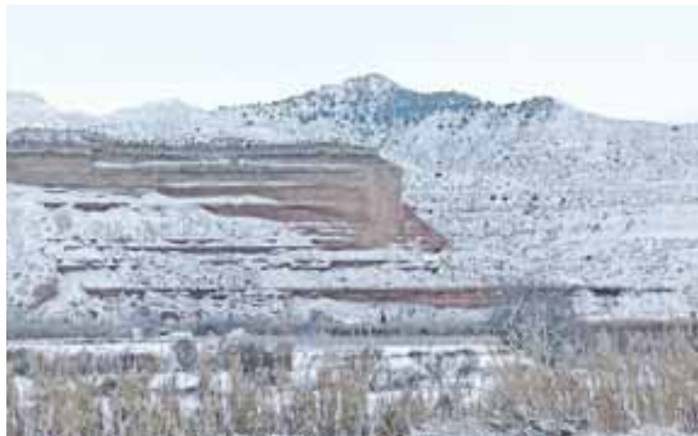
María de Huerva presentó una estampa nevada de sus paisajes.

Las fotos de los paisajes nevados inundaron dispositivos móviles y redes sociales de vecinos de María. ●