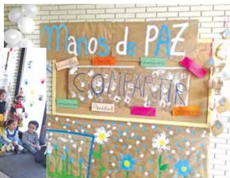
Padres e hijos disfrutaron del Día de la Paz.