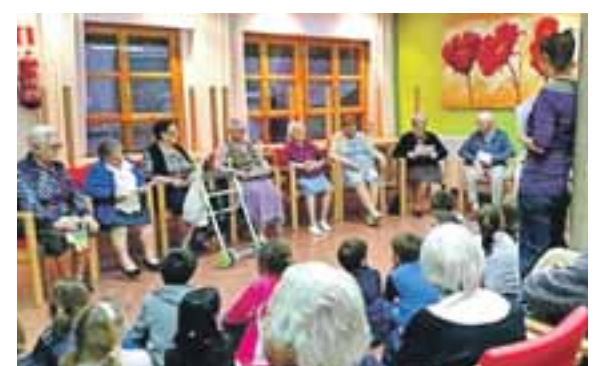
Imágenes de las diferentes actividades, tanto para mayores como para niños, realizadas en la biblioteca.