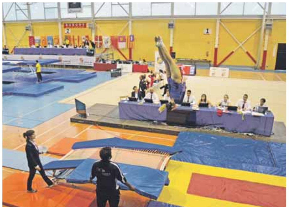
Campeonato de España de Selecciones Autonómicas.

Con esta aportación el Club podrá contar con dos camas elásticas para los gimnastas, lo que les permitirá trabajar más y en mejores condiciones, a la vez que, podrán comenzar con la modalidad de sincronismo. Desde el Club agradecen al Ayuntamiento y al CEIP San Roque, "su complicidad y su apoyo para con nosotros que siempre están apoyando al Trampolín y celebrar con ilusión la construcción del nuevo Polideportivo Municipal donde seguro que todos disfrutaremos del buen deporte que se hace en María". ●