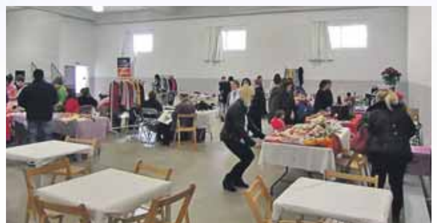
Feria de Navidad.