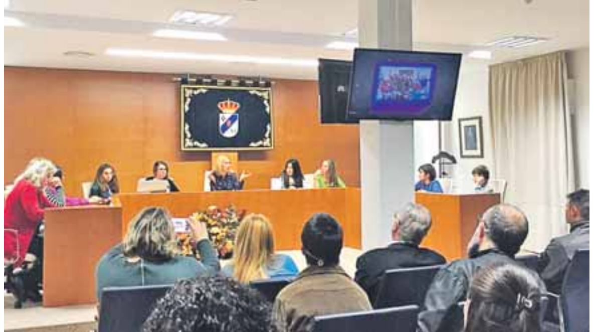
En el Pleno se expusieron los trabajos desarrollados para mantener un pueblo limpio y cuidado dirigidos a los propietarios de perros.

También presentaron sus ruegos y propuestas al Ayuntamiento entre los que se encontraban el arreglo de la valla de las pistas deportivas de la calle Monte Perdido, la instalación de semáforos en la entrada del pueblo, más pasos elevados y la construcción de rotondas