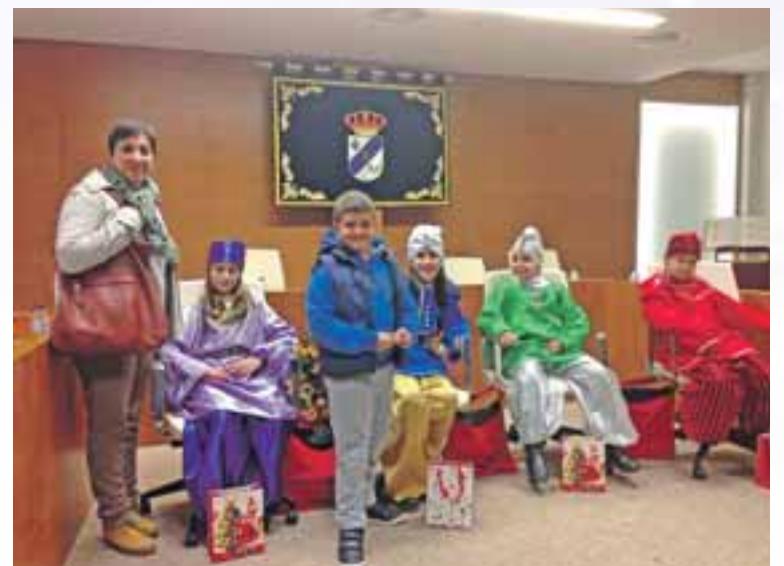
Recogida de cartas a los Reyes por los pajes.