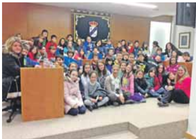
Visita de los escolares de 3º de Infantil.

Días más tarde, y tal y como viene siendo habitual desde hace seis años, los alumnos de 5º de Primaria, tras trabajar con sus profesores materias relacionadas con el Gobierno de las entidades locales, se acercaron hasta la Casa Consistorial para trasladar sus propuestas encaminadas a mejorar la gestión municipal. Temas relacionados con cultura, urbanismo, parques, civismo, festejos, deportes, salud, equipamientos etc. Se trataron en el Salón de Plenos, donde muchos jóvenes defendieron sus propuestas y dejaron patente que el futuro de María de Huerva estará en buenas manos si alguno de ellos, tal y como manifestaron, mantenían su interés por dedicarse a trabajar desarrollando sus ideas y aportaciones. ◉