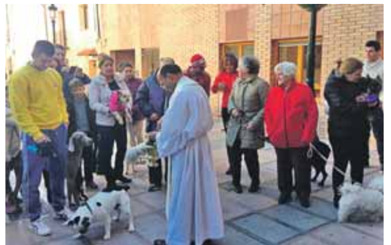
Las mascotas de María de Huerva fueron bendecidas.

Nuestra Señora de la Asunción recibieron la bendición por el párroco D. Cleto y recibieron también su galleta como premio. Salud, bienestar y mejor convivencia con los animales se espera con esta bendición. ●