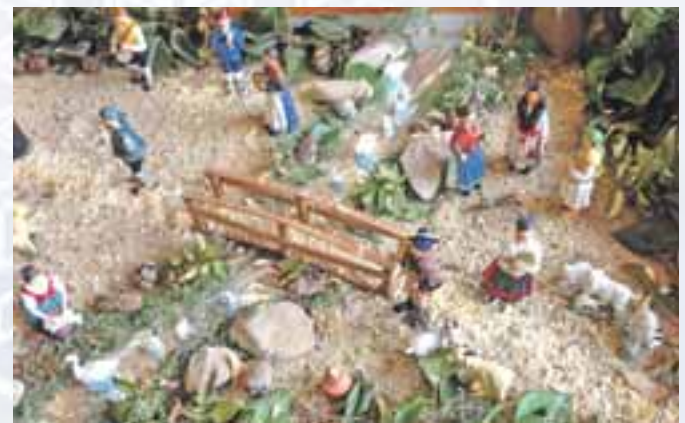
Concurso de belenes.