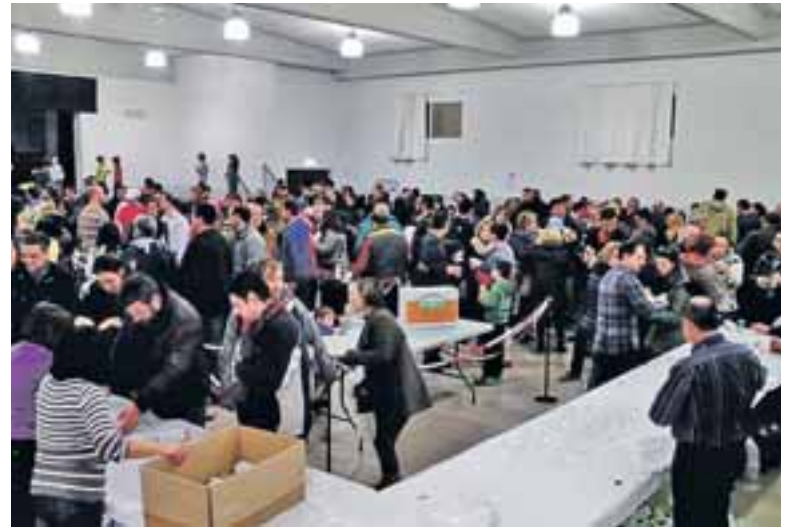
Preparativos del Jueves Lardero.

la creación de la futura Casa Museo de María de Huerva. Cada año, se preparan más y más bocadillos de este rico embutido, este año fueron un total de 950 bocadillos de longaniza elaborada por las carnicerías de María. ●