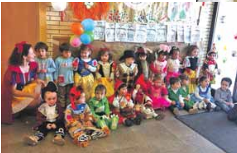
Los más pequeños disfrutaron disfrazándose en la fiesta de carnaval.

La escuela infantil municipal no ha parado de organizar divertidas actividades que enseñan también a los más pequeños a desarrollar valores como la generosidad, el respeto, la tolerancia... Para celebrar el Día de La Paz, los papás de todos los niños aportaron un mensaje personal en la imagen de una paloma, que posteriormente los niños colgaron en el árbol de La Paz, situado a la entrada del centro educativo. También tuvieron su fiesta de carnaval que multiplicó el colorido ambiente que reina en la guardería con los disfraces de Caperucita Roja, la Cenicienta, la Ratita Presumida, Pinocho, el Rey León... todos ellos estaban guapísimos y sus papás emocionados de verles tan felices disfrazados. ●