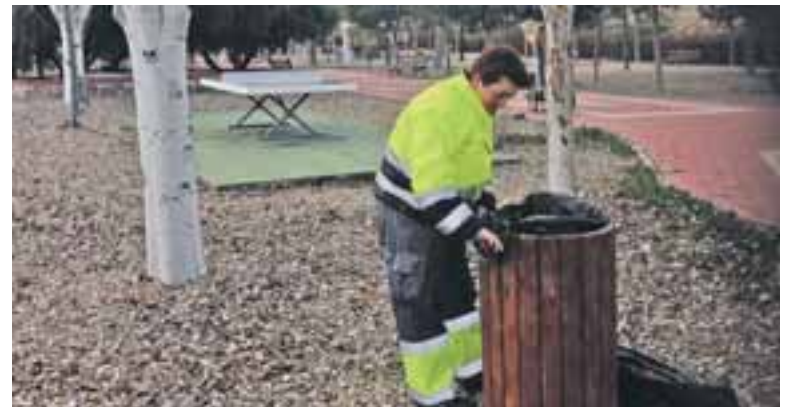
Este Plan ha supuesto un total de 13 empleos en el 2014.

La institución provincial contribuye así a financiar la prestación de servicios a los vecinos por el Ayuntamiento de María de