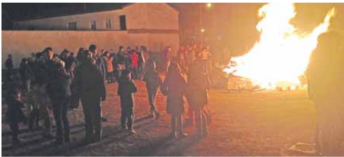
La hoguera de la Asociación Cultural Al-Marya reúne a muchos vecinos.

El frío que suele acompañar en las noches en las que María de Huerva celebra el día de San Antón no impide que muchas familias, grupos de amigos y peñas se reúnan en torno a la hoguera que enciende cada año la