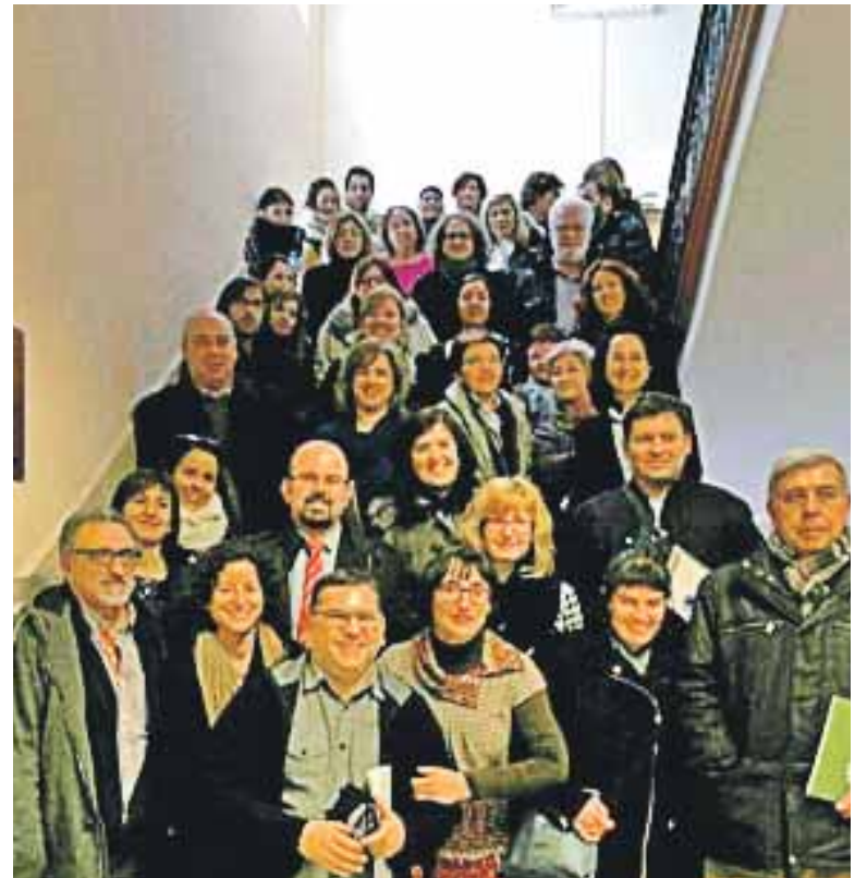
Foto de familia de los participantes.

La reunión se valoró muy positivamente por parte de todos los asistentes, y en ella se compartió la Evaluación del II Encuentro