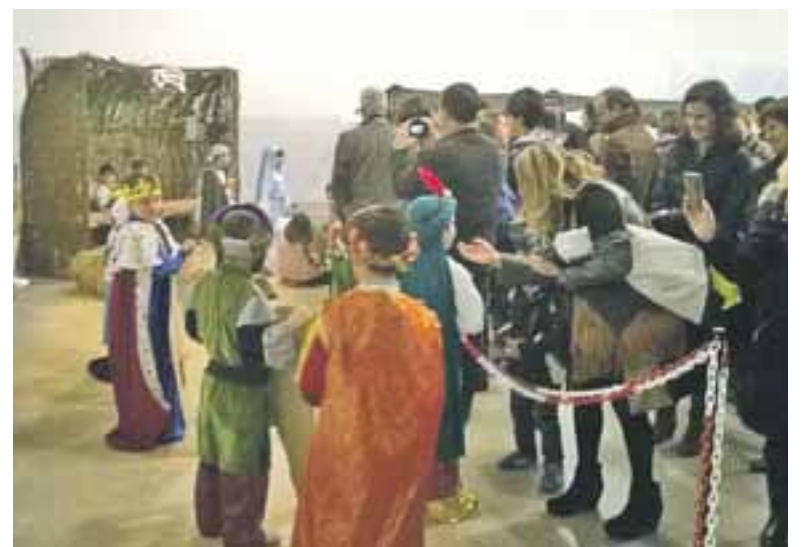
Imágenes de las diferentes actividades organizadas por la Ludoteca.