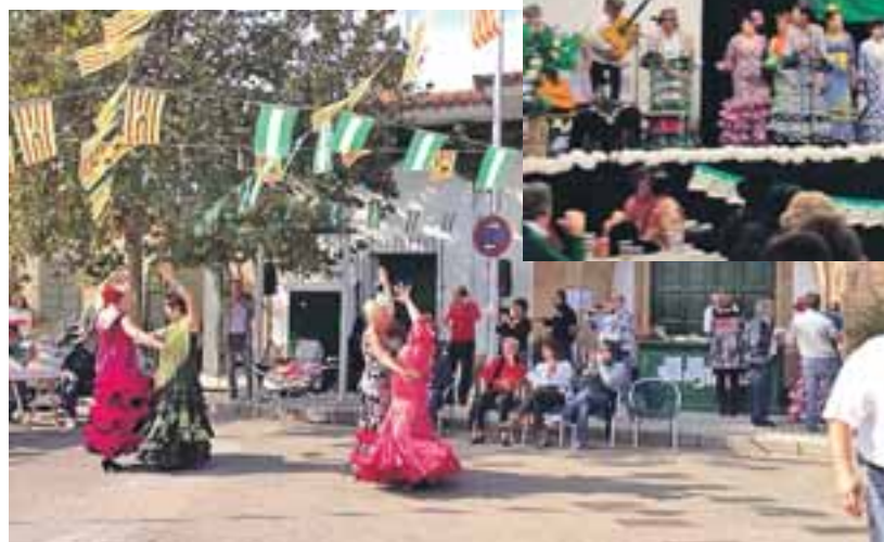
La Hermandad del Rocío organizó los actos del Día de Andalucía.

nan las sevillanas, la Hermandad ya está preparando la celebración de la próxima Feria de Abril. ●