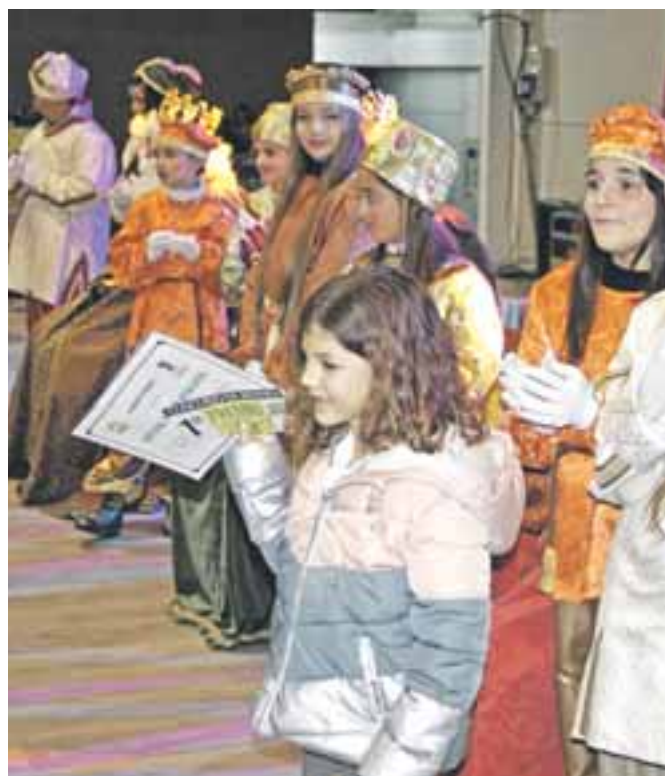
C.PI. Val de la Atalaya, 1er premio del Concurso de Belenes.